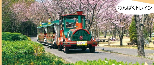
わんぱくトレイン