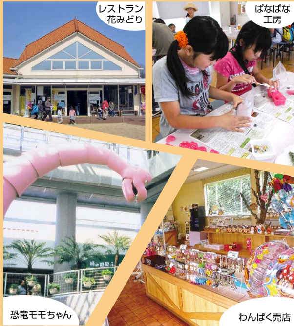
レストラン 花みどり